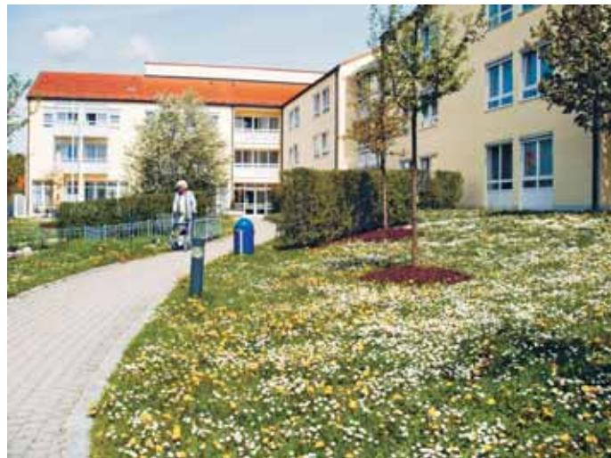
Qualitätsmanagement nach DIN EN ISO 9001:2000